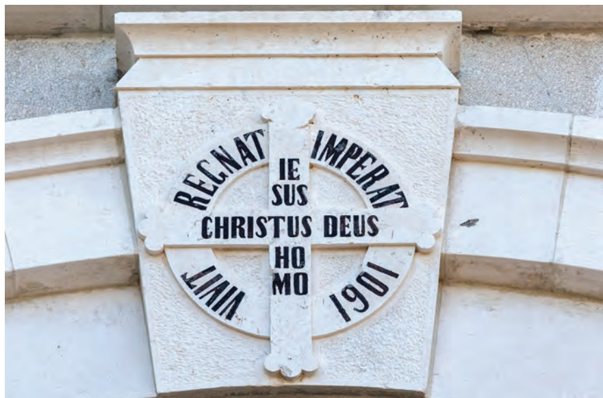
Župnu crkvu sv. Ante resi natpis uklesan u kamenu: Jesus Christus Deus Homo Vivit Regnat Imperat 1901 – Isus Krist Bog čovjek živi vlada kraljuje 1901.