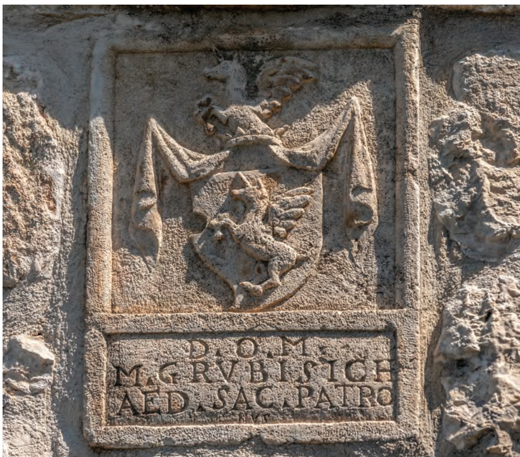
natpisna ploča s imenom graditelja crkve i grbom obitelji Grubišić

zbirci župnoga ureda. Crkva je kao spomenik kulture pod državnom zaštitom. Obnovljena je 2002., a 2011. godine detaljnije sanirana u suradnji i pod nadzorom Zavoda za zaštitu spomenika kulture. Kip sv. Mihovila iz istoimene crkve obnovljen je 2009. O tome više u Izvoru 17 (2009.), br. 7 (35), str. 18.