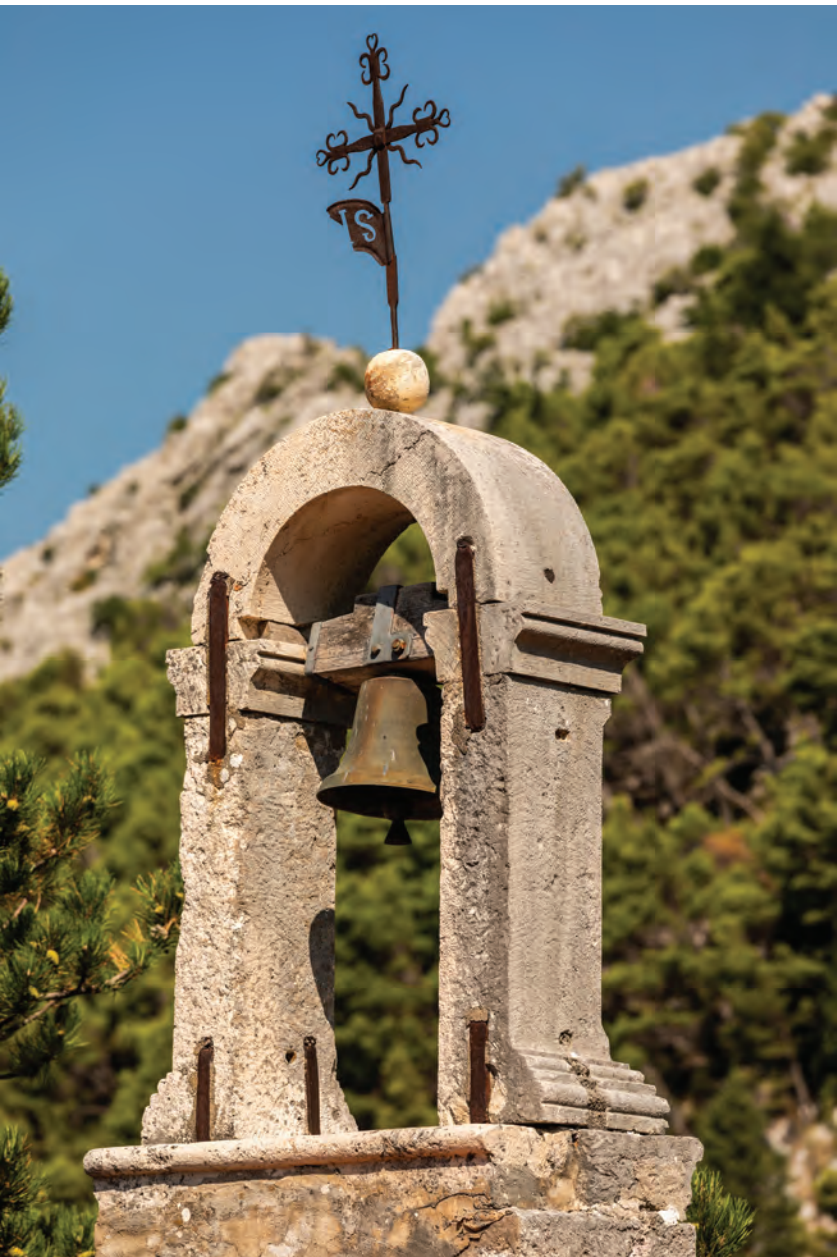
zvonik na preslicu s jednim zvonom