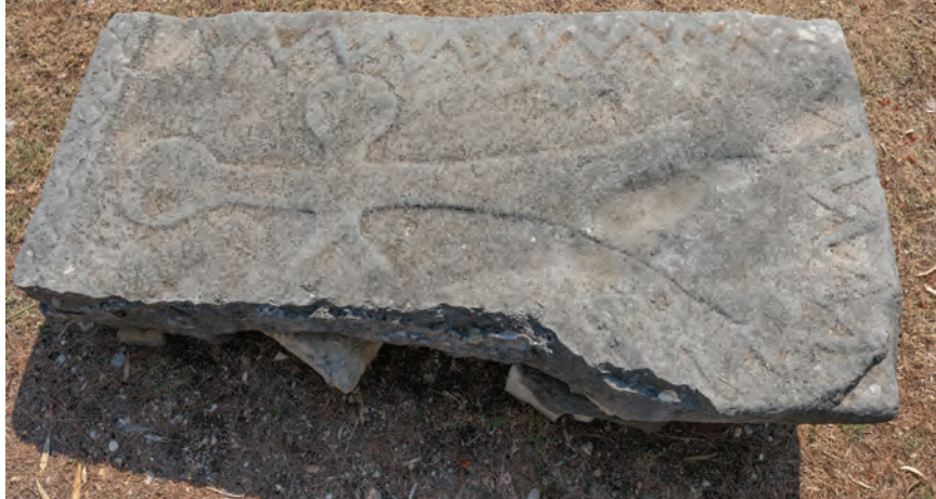
◀ srednjovekovne ploče s reliefnim ukrasima