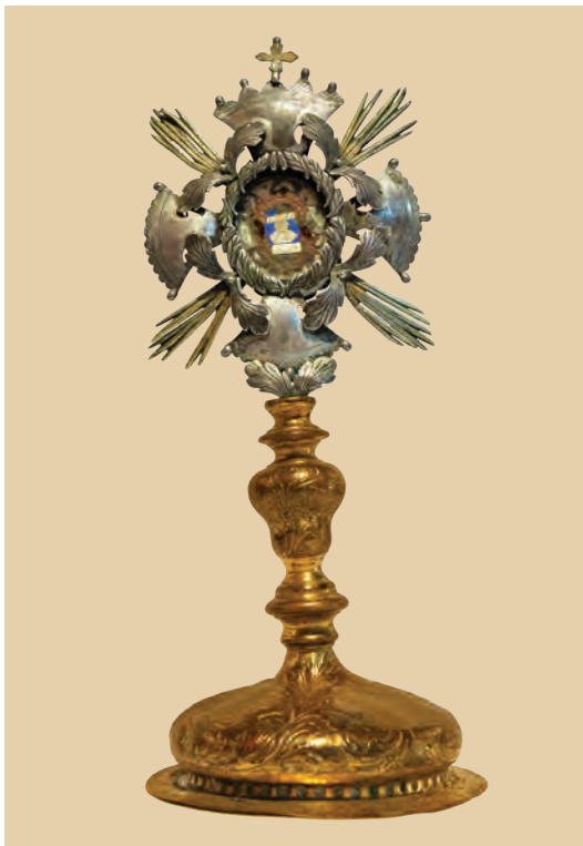
detalji raskošno uređene unutrašnjosti crkve