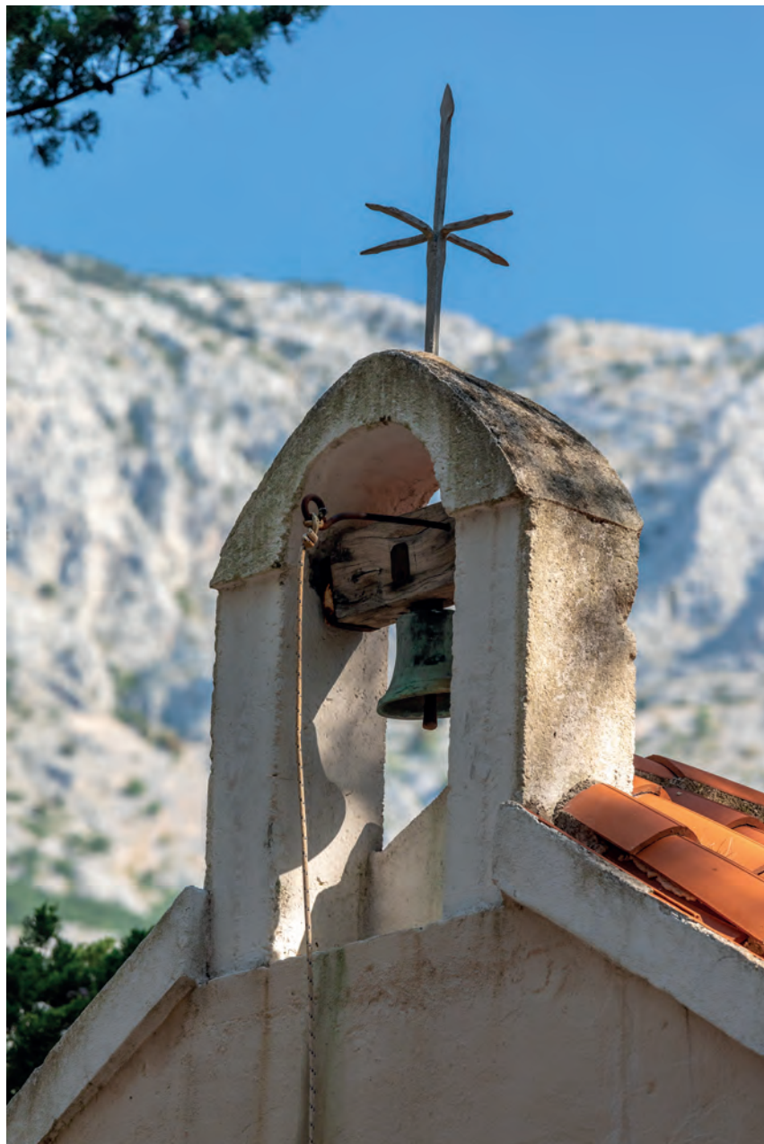
zvonik na preslicu s jednim zvonom