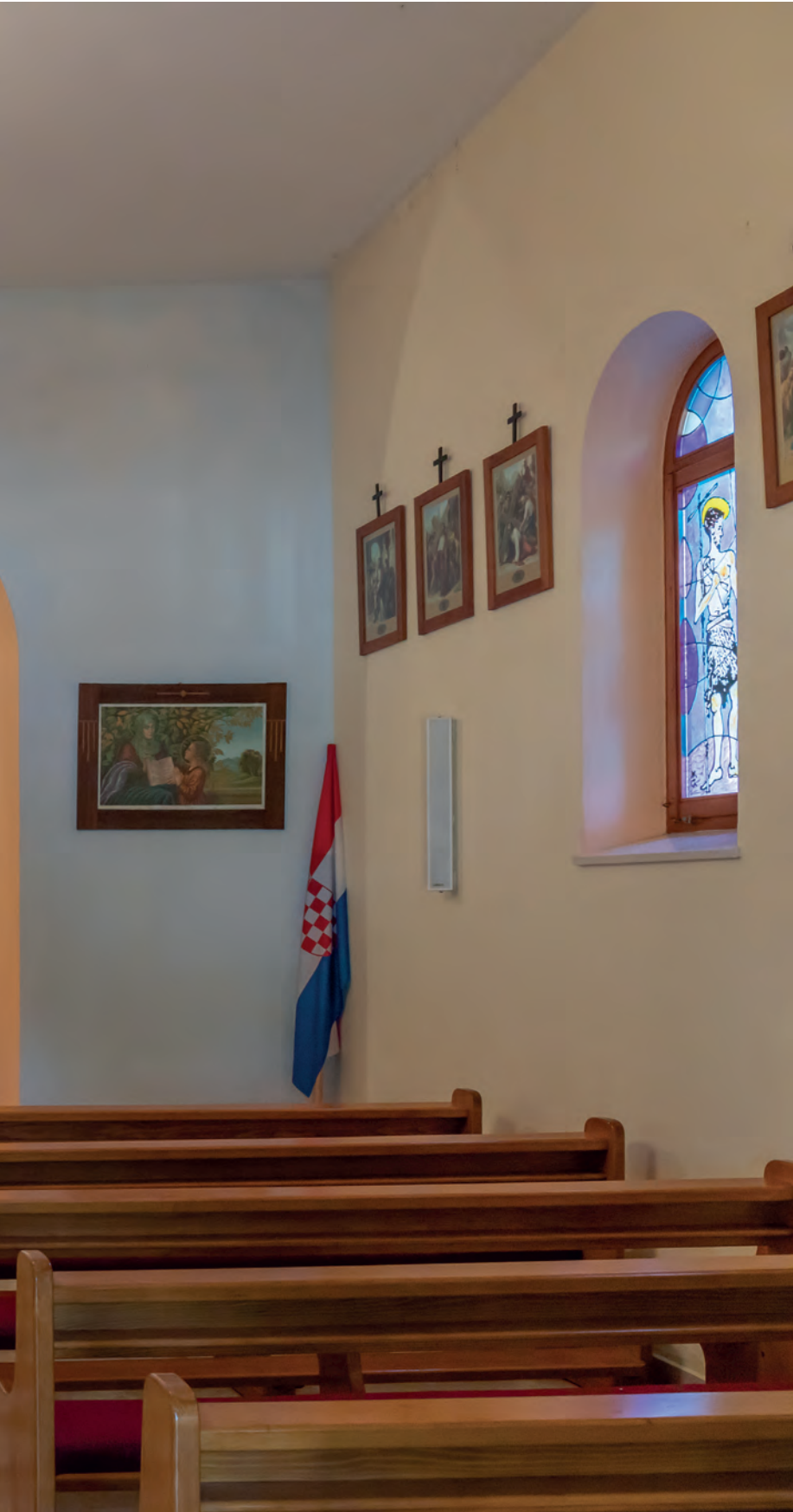
unutrašnjost crkve Gospina rođenja obasjana svjetlošću