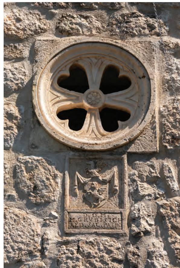
četverolisna kamena rozeta