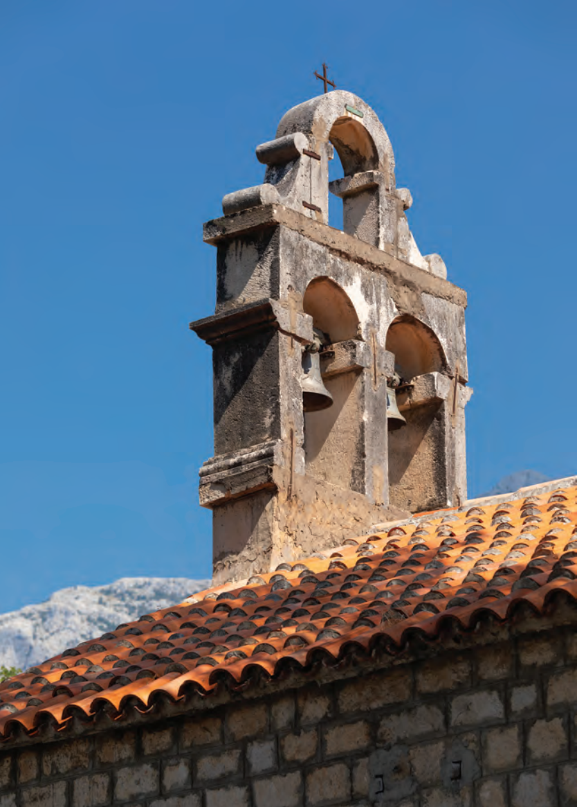
▲ zvonik na preslicu s dva zvona