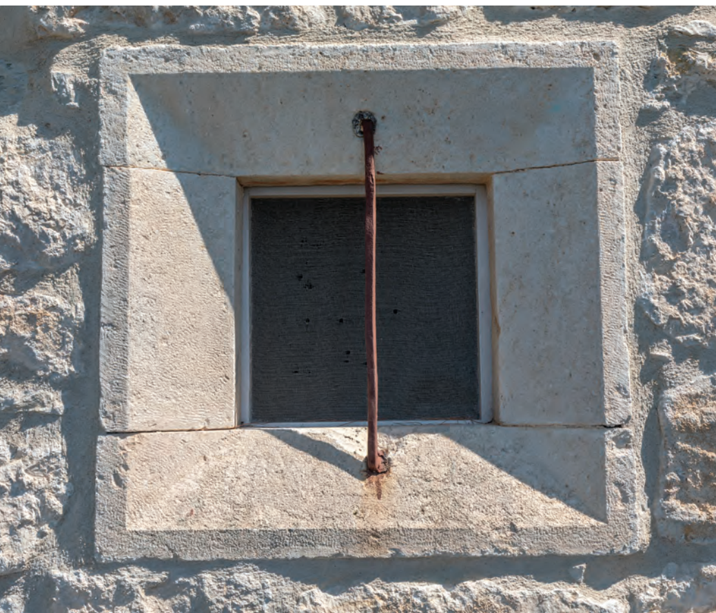
Crkva sv. Mihovila sagrađena je od domaćeg kamena.