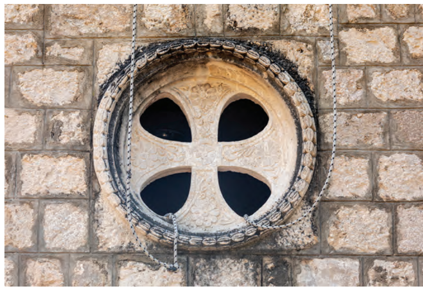
▲ četverolatična rozeta