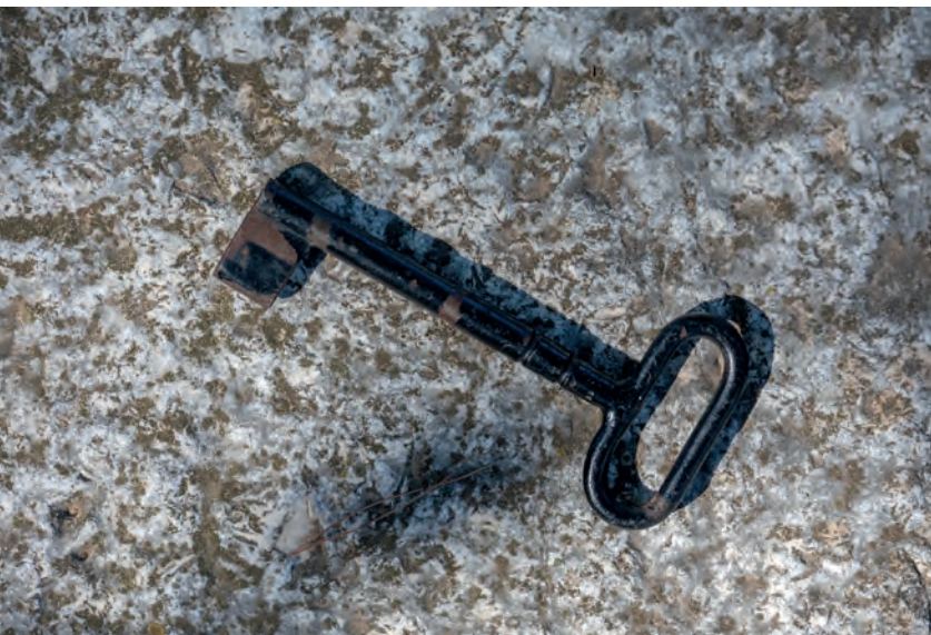
ključ ulaznih vrata