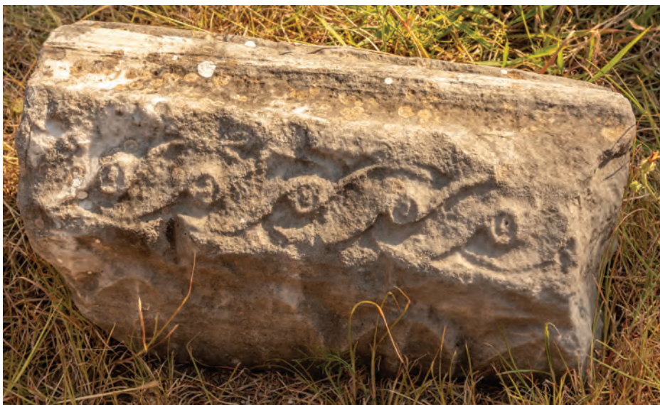
▲ ostatci davnih građevina i grobnih ploča