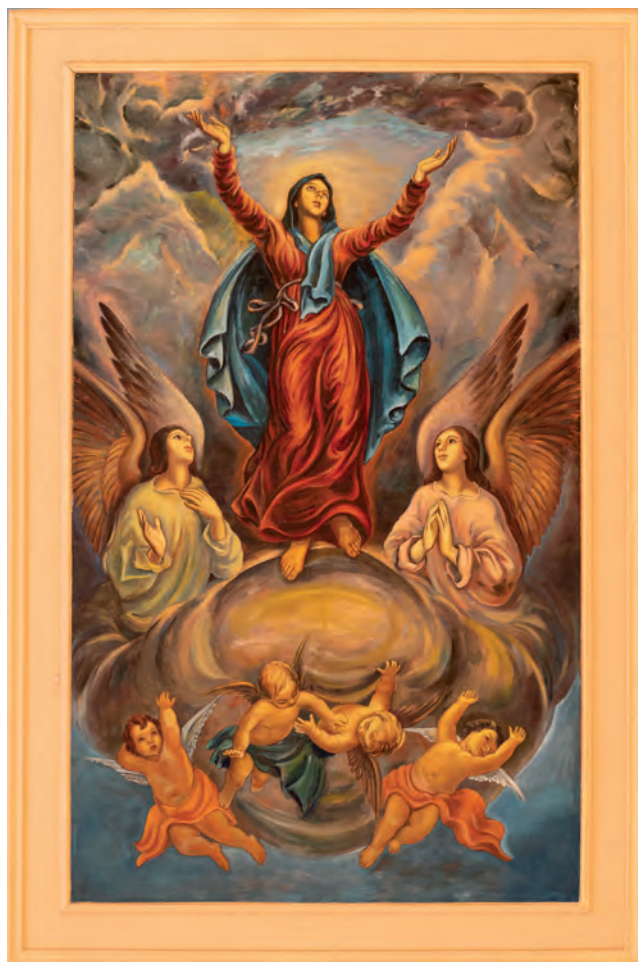
detalj svoda: Gospino uznesenje

Godine 2016. proslavljena je 115. obljetnica gradnje i posvete župne crkve sv. Ante (1901. – 2016.).