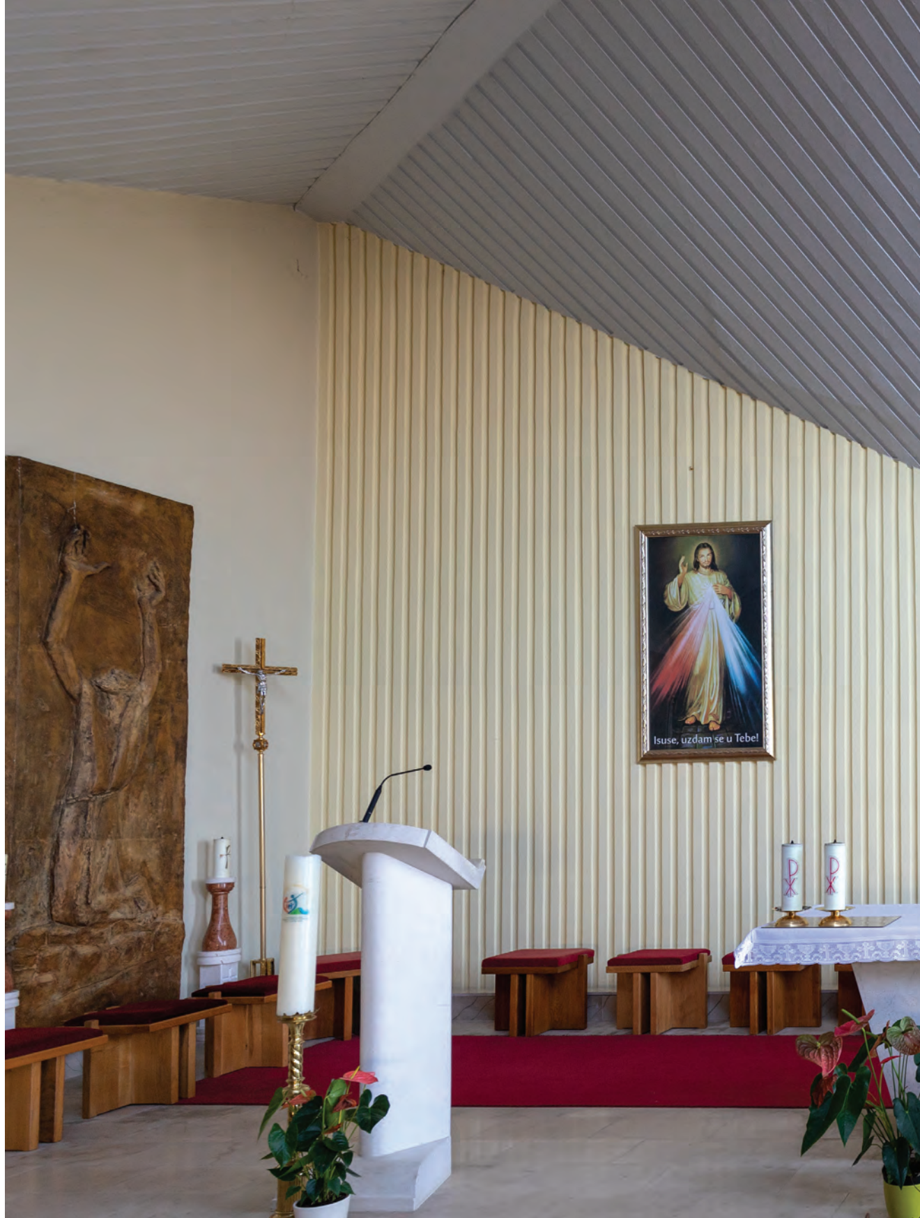
oltar crkve u iščekivanju vjernika