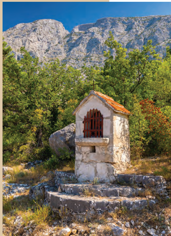
kapelica sv. Kate

fra Gabrijel Jurišić, Sveta Kata – snig na vrata. Sveta Kata Klimentana – do Božića misec dana, Izvor 16 (2008.), br. 5 (33), str. 8. – 11.)