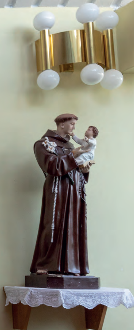
sv. Josip, Majka Božja i sv. Ante – detalji unutarnjeg uređenja crkve sv. Nikole Tavelića