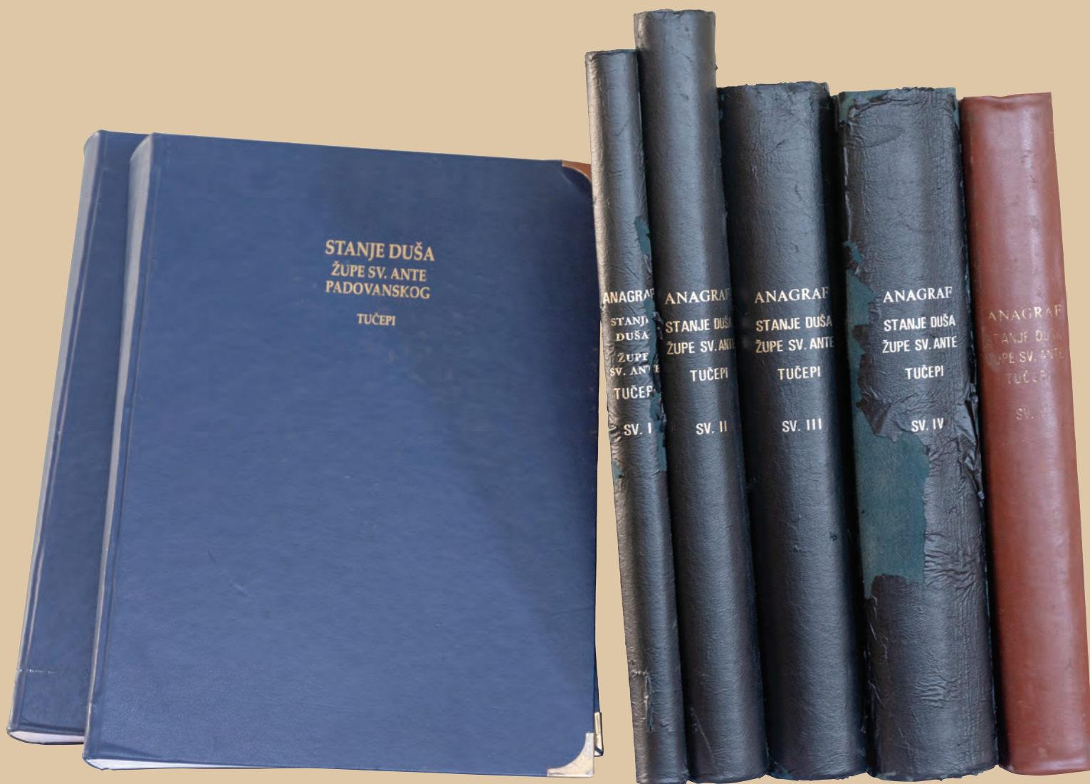
Stanje duša u Župi sv. Ante Padovanskoga u Tučepima (1667. – 2018.)