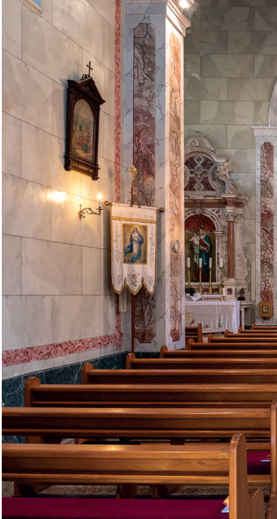
unutrašnjost župne crkve sv. Ante Padovanskoga