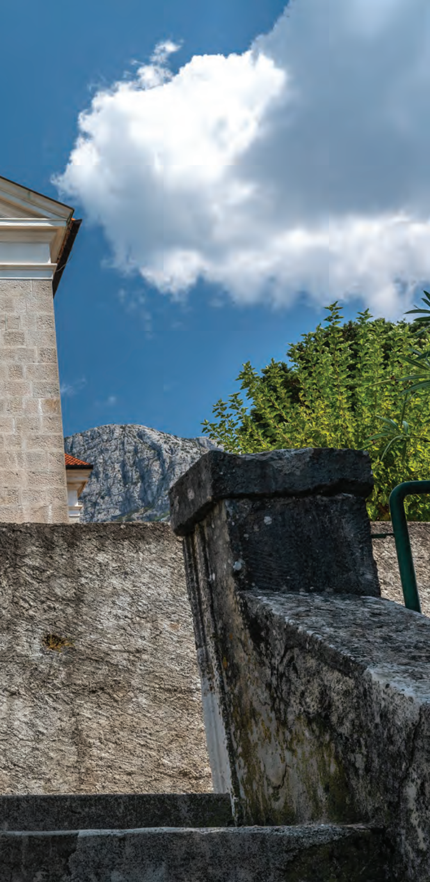
pročelje župne crkve sv. Ante Padovanskoga