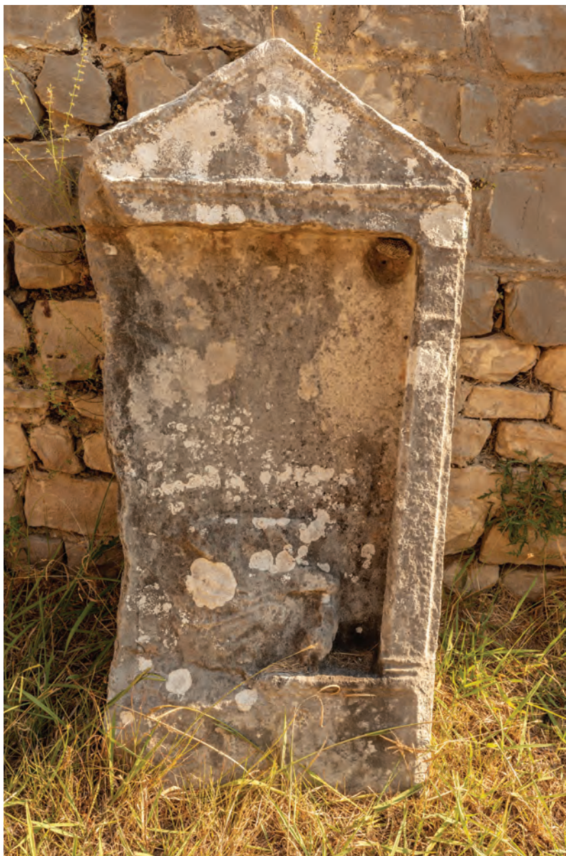
Stela iz 1. stoljeća najraniji je nadgrobni spomenik u Makarskome primorju.