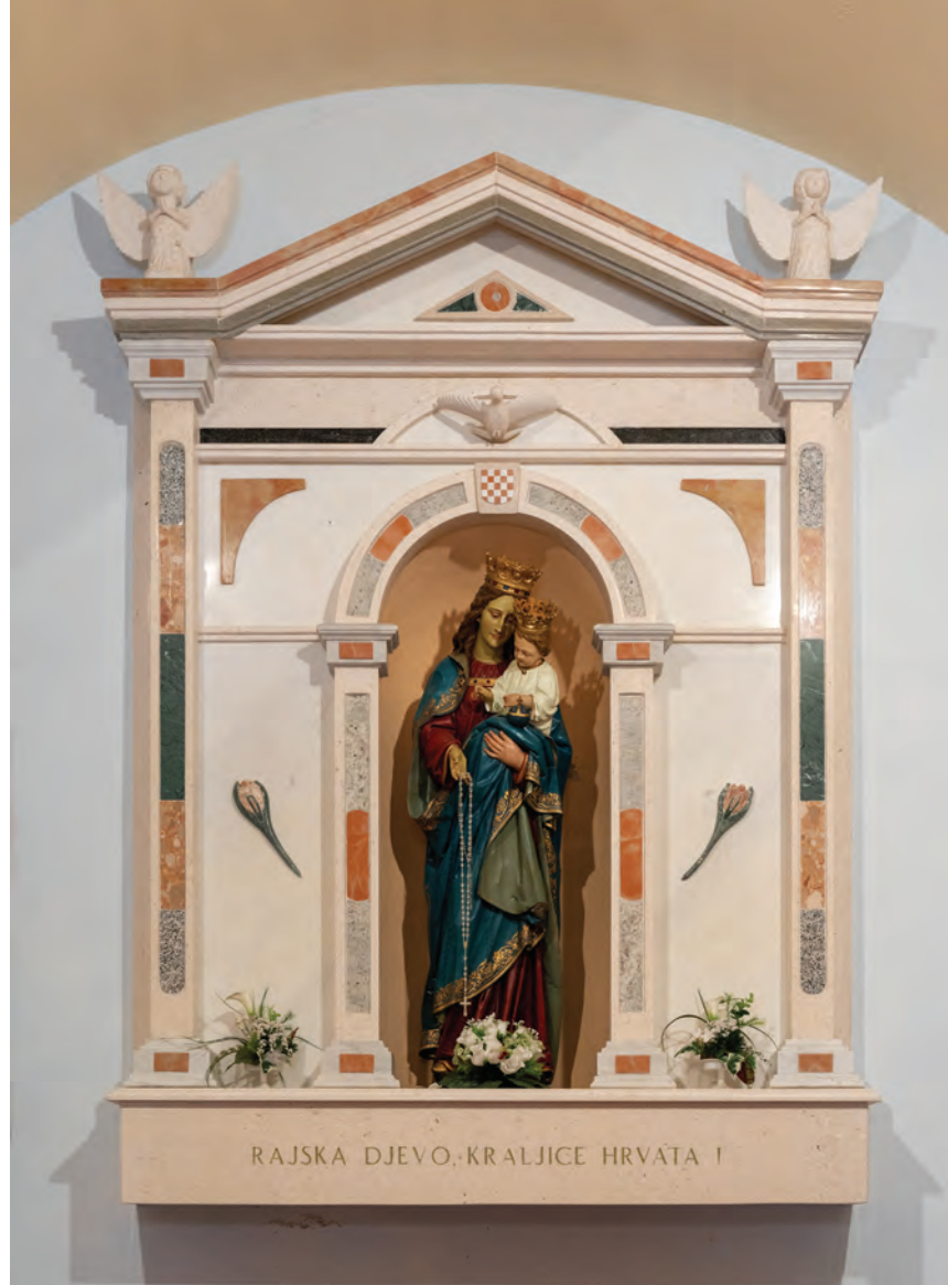
▲ Gospin kip