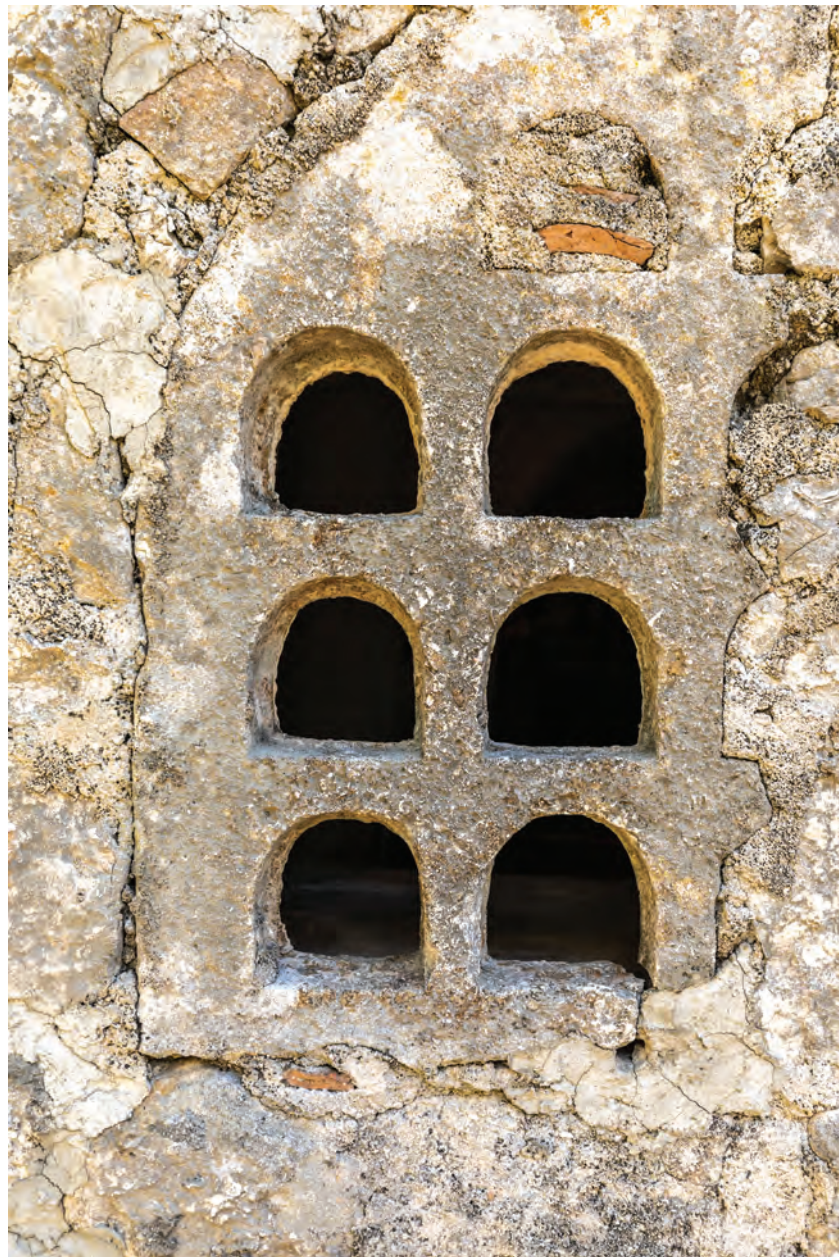
romanička kamena tranzena sa šest polukružnih otvora