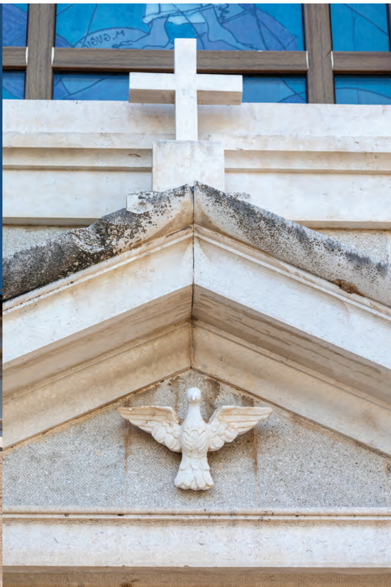
detalji s pročelja crkve