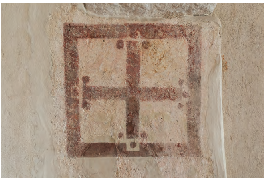
U crkvi sv. Jure nalazi se devet posvetnih križeva unutar kvadratnih polja, oslikanih u 14. ili 15. stoljeću.