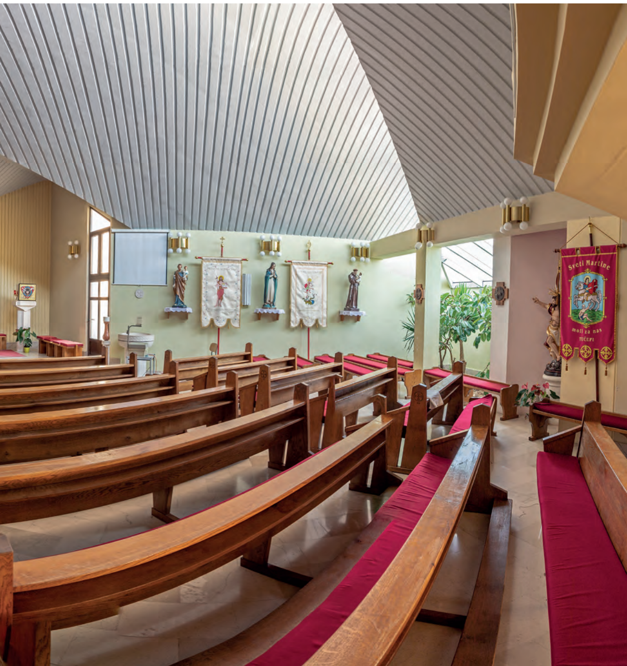
unutrašnjost crkve sv. Nikole Tavelića