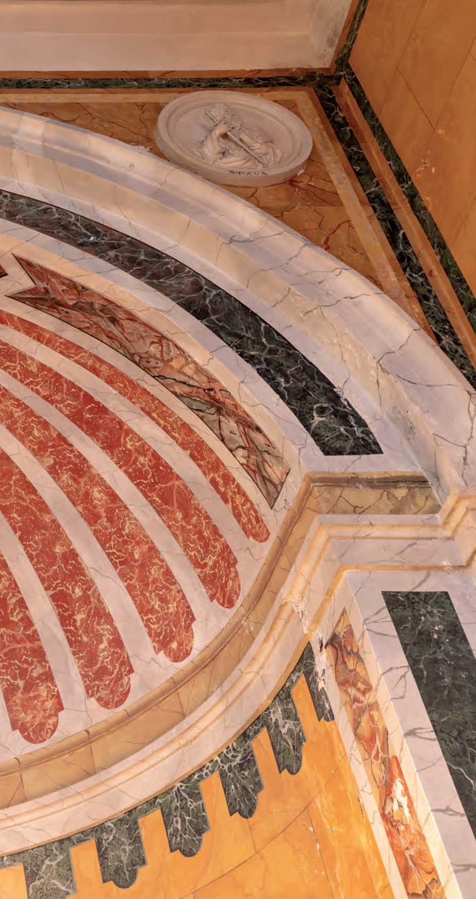
svod glavnog oltara u župnoj crkvi sv. Ante Padovanskoga