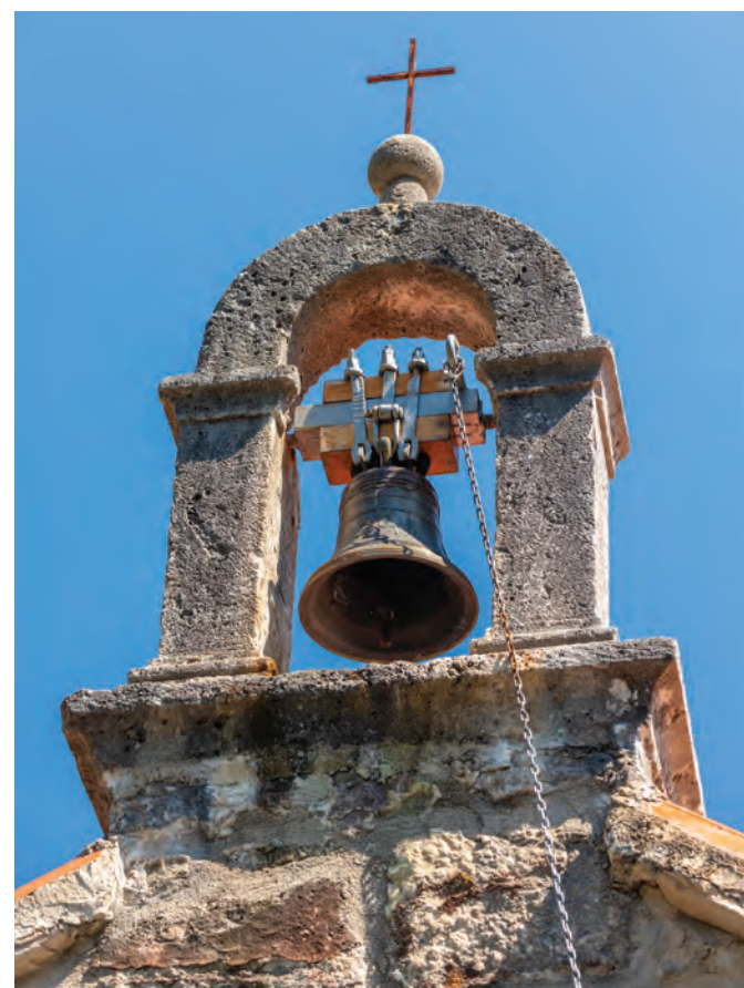
zvonik na preslicu s jednim zvonom