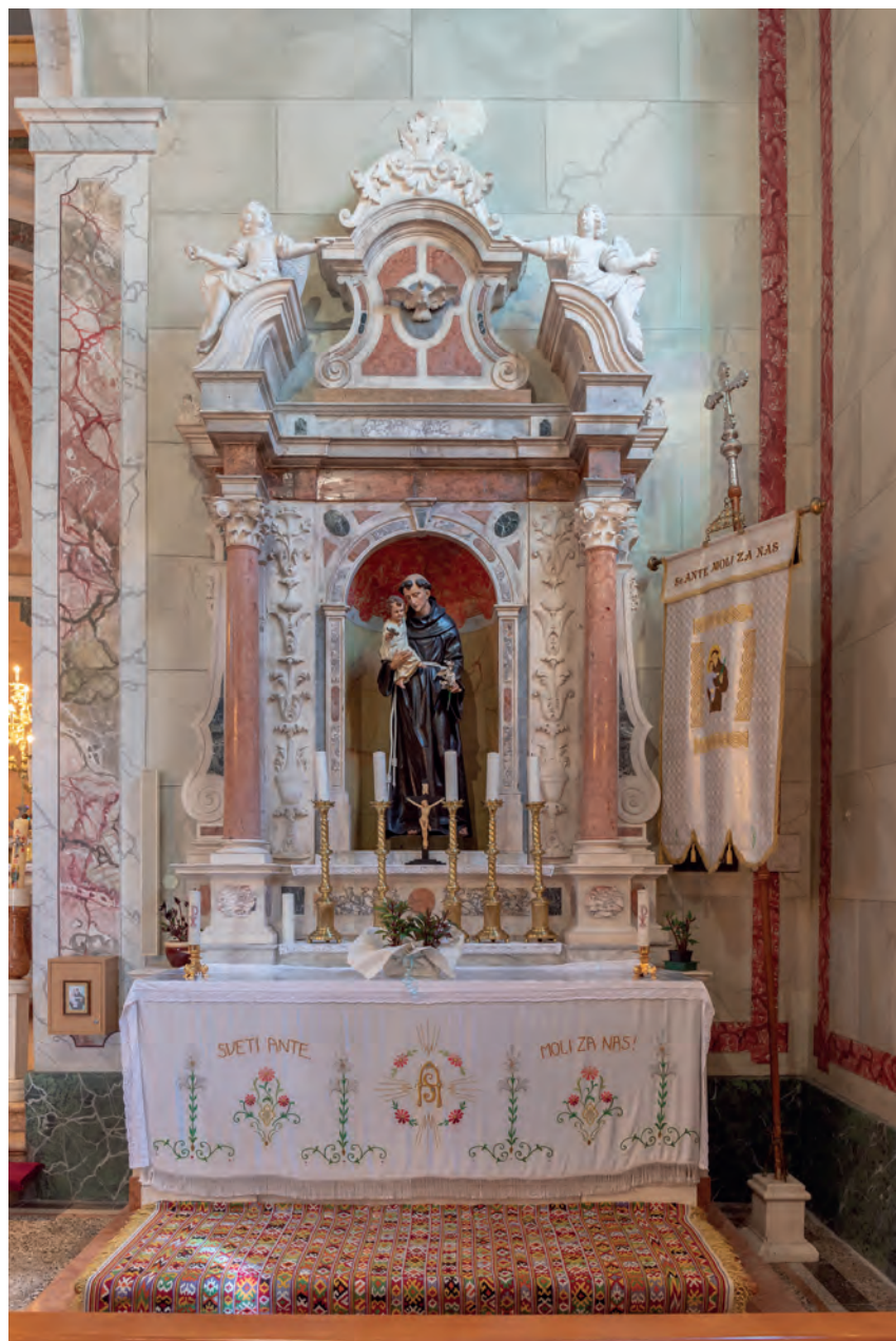
Gospin oltar, glavni oltar s kipovima sv. Franje i sv. Ante te oltar sv. Ante